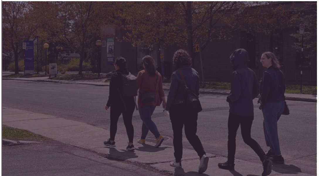
L'équipe de l'Office en visite de terrain dans les rues de Greenfield Park

Ce document présente les valeurs de l'Office, ainsi que les définitions des concepts auxquels l'Office réfère.